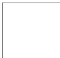
นายปรัชญา มั่นกาล จพง.พัสดุ